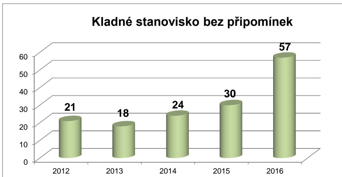
Graf 02. Kladné stanovisko bez připomínek.

Za roky 2012–2014 jsou zahrnována stanoviska pouze k závěrečným zprávám RIA u návrhů věcných záměrů, zákonů a nařízení vlády, nikoliv u návrhů vyhlášek. Ve statistikách od roku 2015 jsou zohledněny také návrhy vyhlášek. V roce 2016 se Komise RIA zabývala 10 vyhláškami, což je o dvě více než v roce 2015.